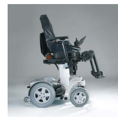
1030 / 1040